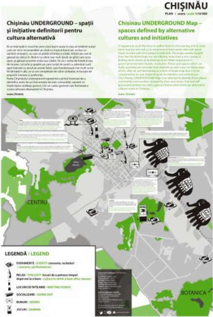
Fig. 7: Vadim Țiganaș, „Chișin u UNDERGROUND – spații și inițiative definitorii pentru cultura alternativ ”, 2010 (design: Diana Draganova) (© Vadim Țiganaș, Diana Draganova).