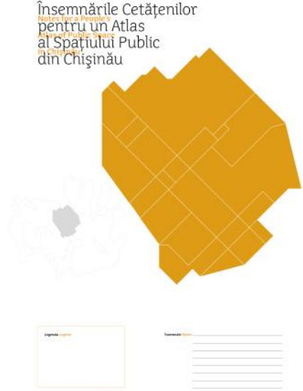
Fig. 8: AREA Chicago, „Însemnările Cetățenilor pentru un Atlas al Spațiului Public din Chișinău”, 2010 (design: Dave Pabellon) (© Dave Pabellon, AREA Chicago).