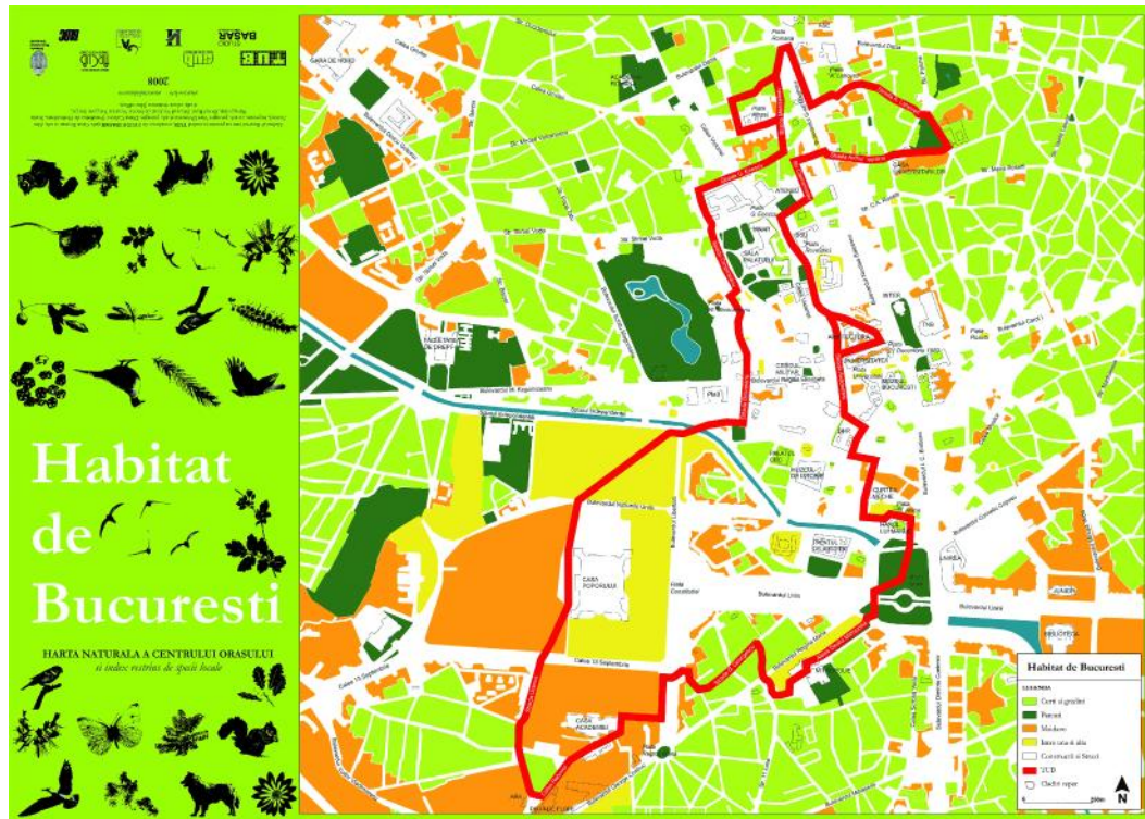
Fig. 1: studioBASAR, „Habitat de București”, 2008.