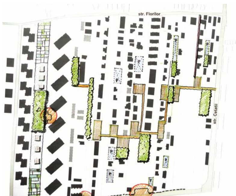
Fig. 9: Grupul SUPERBIA (Marius C t lin Moga, Camelia Sisak, Tamas Sisak), cartare operațional i set de propuneri reparatorii pentru cartierul Flore ti, Cluj, 2013 (© SUPERBIA).