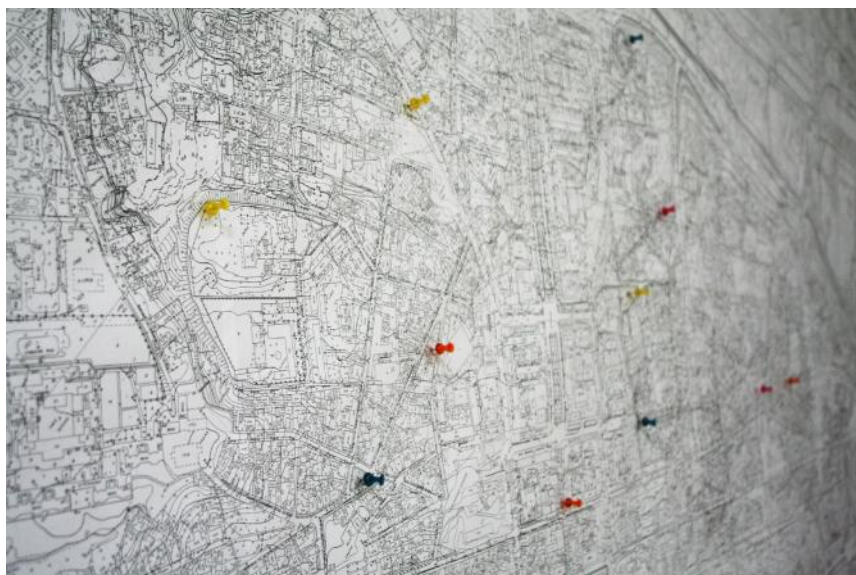
Fig. 6: Asociația Oberliht & Planwerk, „Atelierul de cartografiere a spațiului public din Chi in u”, 2012.