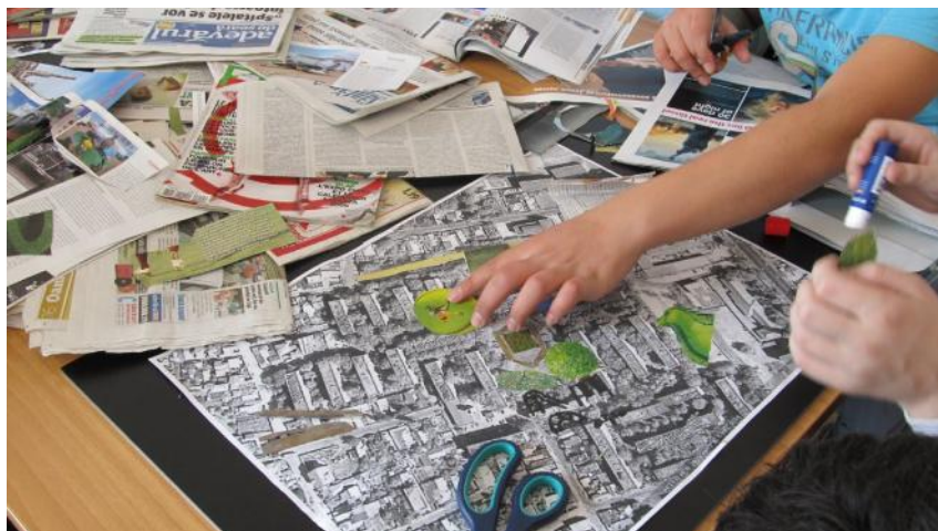
Fig. 5: Asociația Komunitas, intervenția urbană din cartierul bucureștean Ferentari – Aleea Livezilor, 2011.